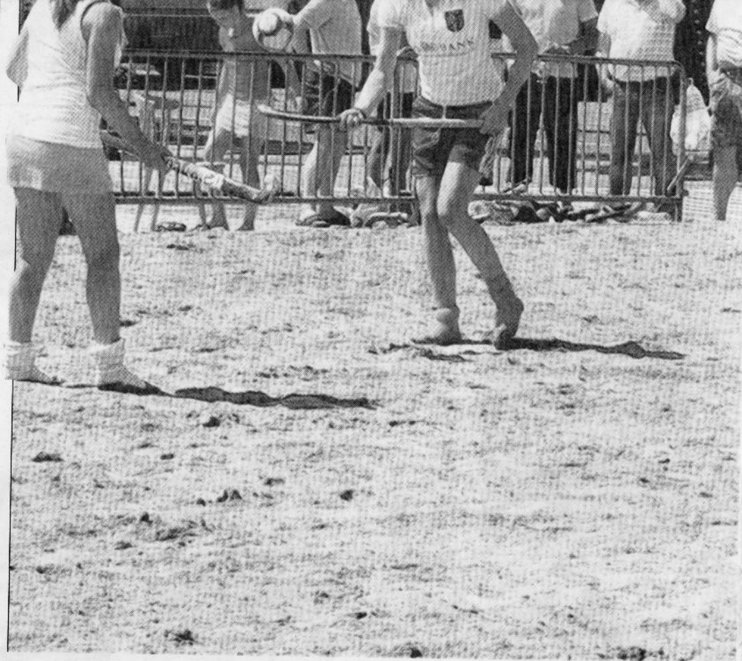
Het zonnige weer zorgde voor veel belangstellenden afgelopen weekend bij het beachtoernooi. Één van de vele sporten was beachhockey.