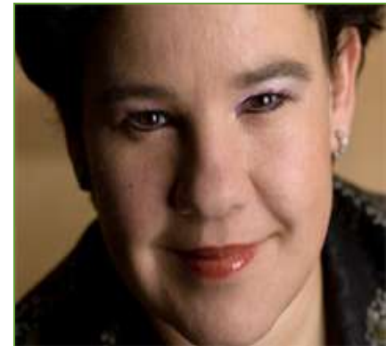
Staatssecretaris Sharon Dijksma Ministerie van Onderwijs, Cultuur en Wetenschap