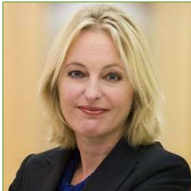
Staatssecretaris Bussemaker Ministerie van Volksgezondheid, Welzijn en Sport