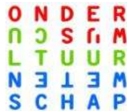
Ministerie van Onderwijs, Cultuur en Wetenschap